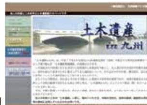
土木遺産 in 九州