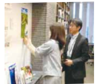
BIZCOLI 「土木遺産な旅のススメ」 特設コーナー