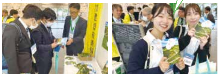
土木分野への就職を検討している学生たち