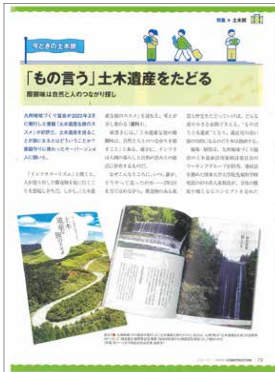
日経コンストラクション2023年10月号 「特集：土木旅」