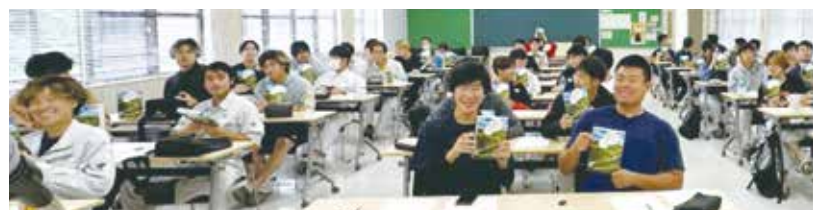
未来の農業を担う学生たち