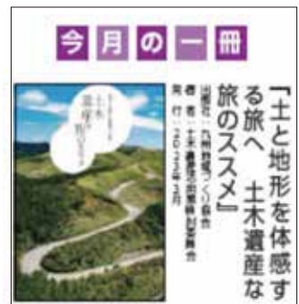
「九州経済調査月報」 BIZCOLI PRESS