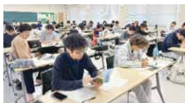
農業大学校 販路創造デザイン演習の風景