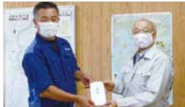
球磨村長への受け渡し(R2.8.18)