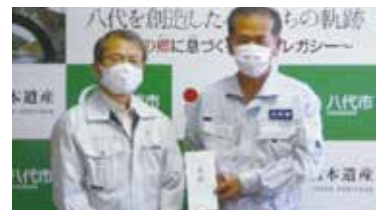
八代市長への受け渡し(R2.8.19)