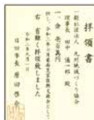
日田市からの拝領書