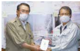
芦北町長への受け渡し(R2.8.19)