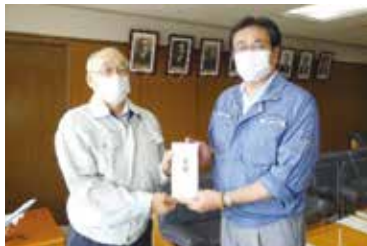
日田市長への受け渡し(R2.9.1)