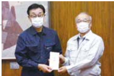
大牟田市長への受け渡し(R2.8.31)