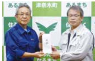
津奈木町長への受け渡し(R2.8.19)