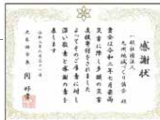
大牟田市からの感謝状