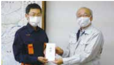
人吉市長への受け渡し(R2.8.18)

北町、津奈木町）、8月31日：福岡県大牟田市、9月1日：大分県日田市に対して寄付金目録の受け渡しを行い、当協会として、被災自治体の速やかな復旧・復興を支援しました。