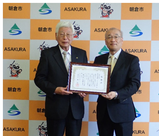
市長との記念写真