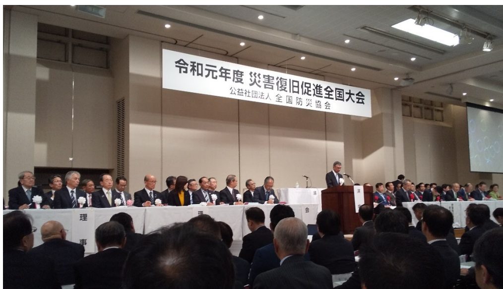
令和元年度 災害復旧促進全国大会での協会長挨拶の様子

去る令和元年11月5日（火）午後、東京都千代田区の砂防会館別館において、平成29年7月の九州北部豪雨災害の際、朝倉市における災害復旧までの初動支援や災害記録誌の作成などの先進的な取り組みは、今後の大規模災害時の被災自治体支援の礎となるとの高い評価を頂き、今回、表彰状を賜りました。