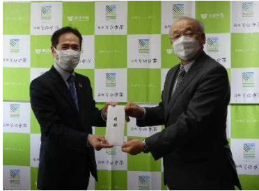
東彼杵町での寄付金目録受け渡し