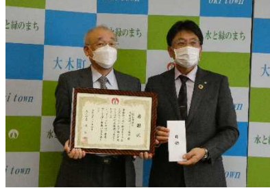
大木町での寄付金目録受け渡し及び感謝状