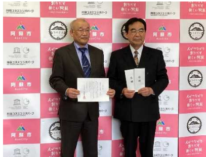
阿蘇市での寄付金目録受け渡し及びお礼状